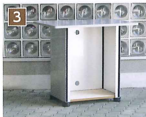
3 天板と側板のマジックテープを合わせる