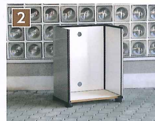
2 底板と側板のマジックテープを合わせる