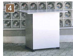
4 フロントパネルの位置合わせをする