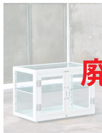
② ※HD ガルバナイズド、ロウ、Hグレーはありません。