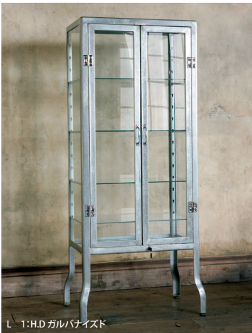
L 1:HD ガルバナイズド