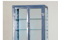
7:ハンマートーングレー