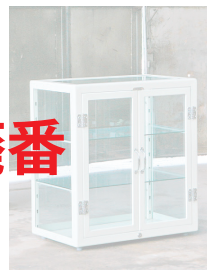
③ ※HD ガルバナイズド、ロウ、ブラウン、Hグレーはありません。