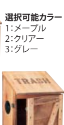
キャスター付 メーブル