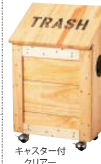
キャスター付 クリアー