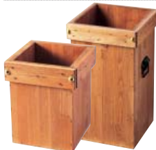
小 1: メーブル 大 1: メーブル

フタを開けてポリ袋を中の木枠にセットします。 ポリ袋がいっぱいになったら前の扉を開けて取り出すことができます。 本体の両サイドには通気孔があります！