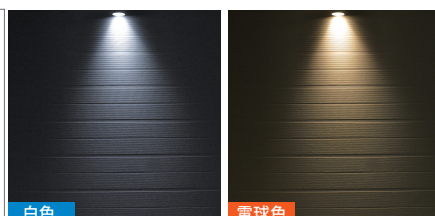
[ 点灯画像 ]