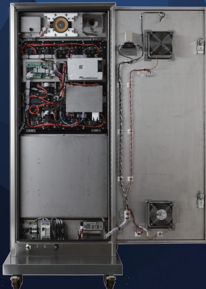
PiPit-VISION mini ハーフディスプレイタイプ