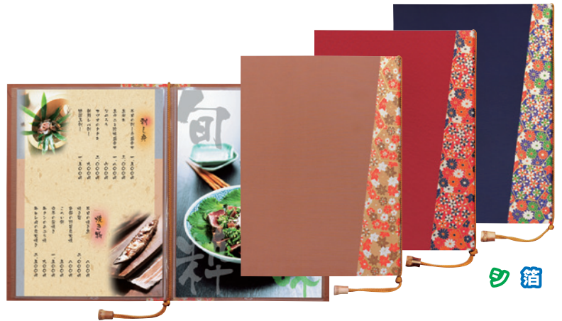
京-2 (中) (4ページ仕様)