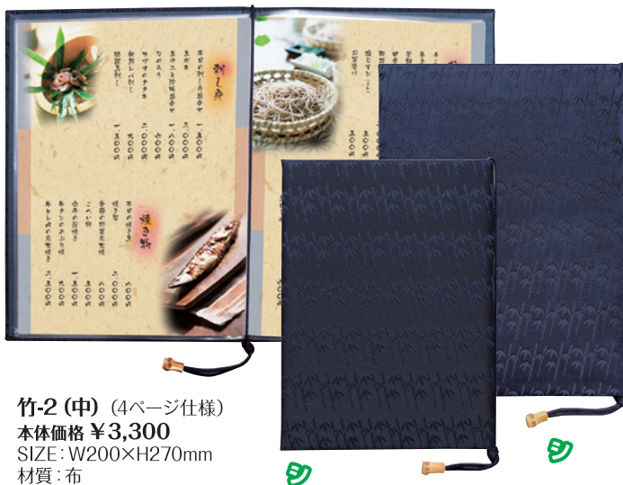
竹-2 (中) (4ページ仕様)