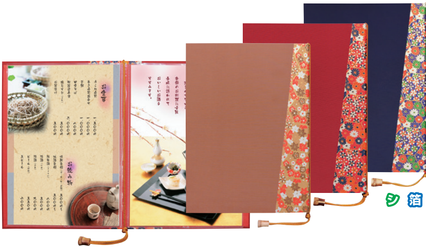
京-1 (大) (4ページ仕様)