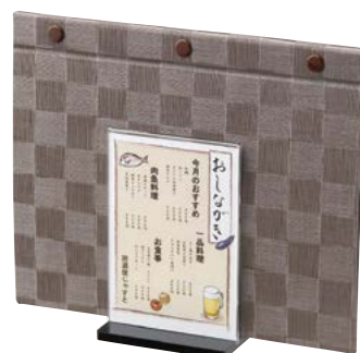
〈使用例〉メニューブック立て&メニュー