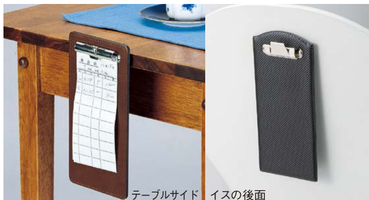
テーブルサイド イスの後面

★マグネットだけ付け、冷蔵庫 や鉄面でご利用下さい。 椅子の背に貼り付けても ご利用できます。