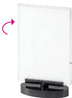
RS-105B (タテ小) ¥2,400 S:W105×H172mm C:ブラック、Lot:10 紙サイズ (A6)