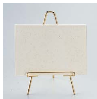
ミニイーゼルカード立て MS-1 ¥2,600 S:100×170mm C:ブラック・ゴールド、Lot:10 (上部アクリル 148×105mm)