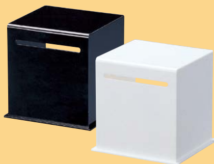
ES-3 カード・アンケートボックス ¥5,500 S:W120×H123×110mm C:白・黒、Lot:1