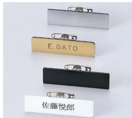
ネームプレート NP-100 無地 S:70×20×2mm、Lot:20 C:ゴールド・シルバー ¥390 C:黒・白 ¥340 ★ピン・クリップ両用タイプ