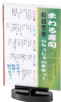
回転式カード立て RS-104B (タテ中) ¥2,900 S:W128×H203mm C:ブラック、Lot:10 紙サイズ (B6)