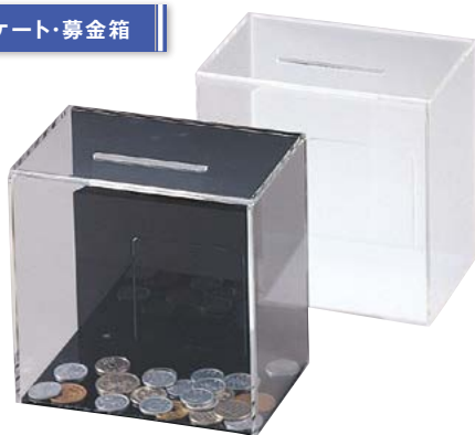
ES-2 アンケート・募金・応募BOX ¥5,800 S:W147×H149×D100mm C:白・黒、Lot:1 ★後方にカギがつけられます。