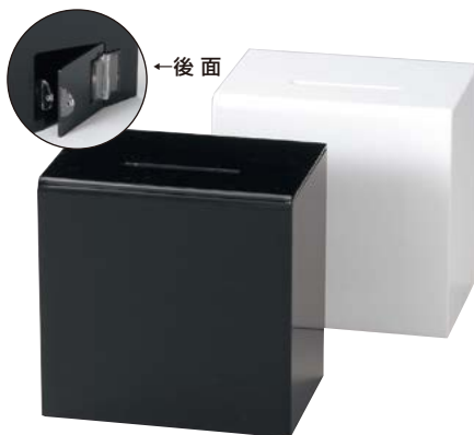
ES-6 アンケート・募金・応募BOX ¥5,600 S:W147×H149×D100mm C:白・黒、Lot:1 ★後方にカギがつけられます。