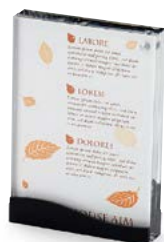
マグネット式カードスタンド C:ブラック・ミラー、Lot:10 NS-112 (中) ¥3,500 S:128×H185×20mm 紙B6 NS-113 (小) ¥2,800 S:105×H151×20mm 紙A6 ●両面タイプ ●紙落ち防止あり