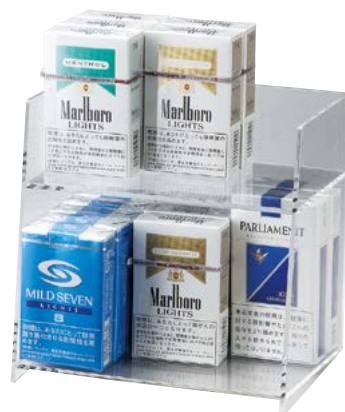
TC-22 タバコケース ¥2,900 S:W178×H166×D122mm C:アクリルクリア (3mm)、Lot:1 上段3列 (1列約4コ)、下段3列 (1列約5コ)