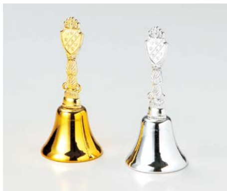
ディナーベル (スイングタイプ) CB-94 ¥1,000 S:40φ×H95mm C:ゴールド・シルバー、Lot:10