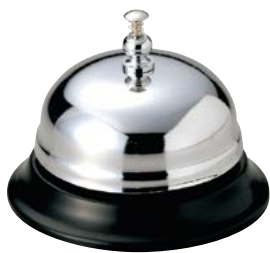
ディナーベル (プッシュタイプ) CB-91 ¥1,100 S:78φ×H60mm C:シルバー Lot:1