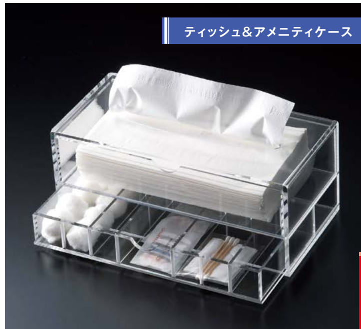
アクリルティッシュ&アメニティボックス ATC-100 ¥9,500 本体 S:W267×H110×D130mm 上1段 S:W257×H58×D127mm (内寸W251×H55×D121mm) 下1段 S:W257×H38×D127mm (内寸W251×H35×D121mm) C:クリア、Lot:1 ★下段は仕切り板が取り外し出来ます。 (移動)