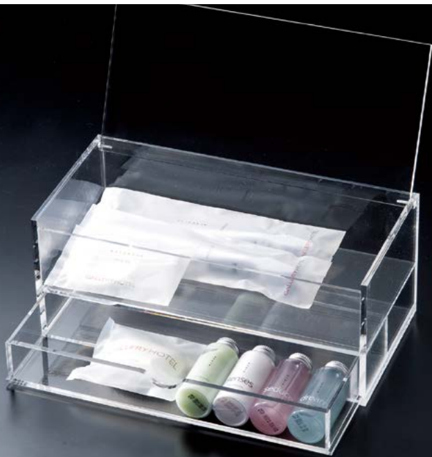
アクリルアメニティボックス(ふた付) ATC-101 ¥9,200 本体 S:W267×H110×D130mm 上1段 S:W267×130mm (内寸W257×H55×D124mm) 下1段 S:W257×H38×D127mm (内寸W251×H35×D121mm) C:クリア、Lot:1