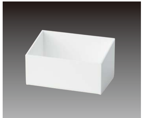
アクリル多目的ケース TC-38 ¥1,500 S:W144×H78×D89mm C:ホワイ、Lot:1