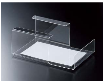
アクリルティッシュボックスホルダー(マグネット式) TBC-100 ¥2,600 S:W120×H170×D67mm、C:クリア、Lot:1