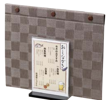
〈使用例〉メニューブック立て&メニュー

●スタンドの紙のサイズ 特大(B5):182×257mm 大(A5):148×210mm 中(B6):128×182mm 小(A6):105×148mm