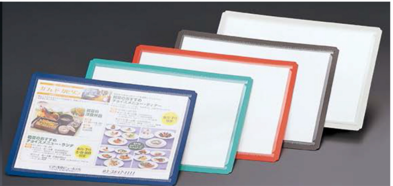
カード型メニュー(両面使用) C:ブラック・レッド・ブルー・グリーン・アイボリー, Lot:10 SB-6(大)A4タイプ ¥650 S:335×250mm SB-7(中)B5タイプ ¥550 S:295×220mm ★サービスメニューに最適! ★ポケット部分はやさしくお使い下さい。