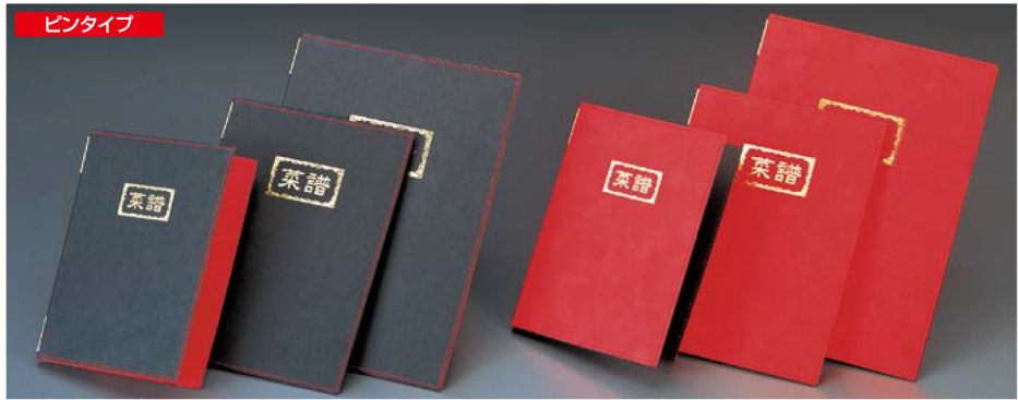
ピンタイプ ラバーチャイナメニュー (ピンタイプ) ★ピンがぬけにくい新構造 ★メニューピンMP-111ゴールド使用 RB-200(特大・B-4) ¥3,900 S:280×392mm RB-201(大・A-4) ¥2,800 S:232×325mm RB-202(中・B-5) ¥2,500 S:203×285mm C:ブラック・レッド P:4, Lot:10