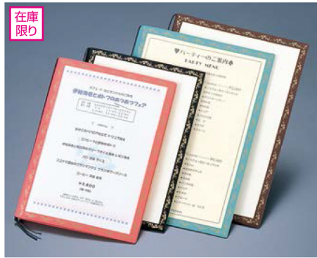
在庫限り PPカラーメニュー(2色柄) P:4, Lot:10 PA-41(大・A-4) ¥1,200 S:230×315mm PB-51(中・B-5) ¥900 S:200×275mm C:ブラック・ブラウン・グリーン・ローズ枠, ゴールド柄(本体クリア) ★中身を増やせます。洋風中紙・ビニールをご用意下さい。