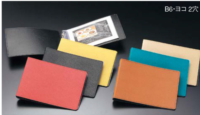
レザータッチファイルミニメニュー(金属B6ヨコ2穴) LB-807 ¥2,800 S:224×166mm C:赤・黒・イエロー・茶・エメラルドグリーン・うす茶 P:4, Lot:10 ビニール(B6ヨコ2穴) 紙 無地(B6) ★紙だけセットの場合はA5まで利用できます。