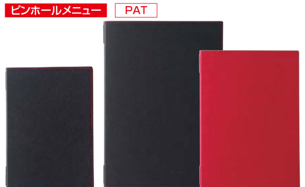
ピンホールメニュー PAT ラバーピンホールメニュー ピンタイプ RB-260(特大・B-4) ¥3,800 S:280×392mm ビニール 中紙(B-4) RB-261(大・A-4) ¥2,700 S:232×325mm ビニール 中紙(A-4) RB-262(中・B-5) ¥2,400 S:203×285mm ビニール 中紙(B-5) C:ブラック・レッド P:4, Lot:10 ★メニューピンMP-111ゴールド使用