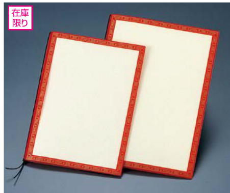
在庫限り PPカラーメニュー 中華(2色柄) PA-42(大・A-4) ¥1,200 S:230×315mm P:4, Lot:10 PB-52(中・B-5) ¥900 S:200×275mm P:4, Lot:10 C:レッド枠ゴールド柄(本体クリア) ※中をふやせます。洋風中紙・ビニールをご使用下さい。