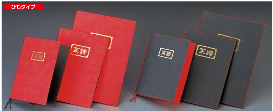
ひもタイプ ラバーチャイナメニュー (ひもタイプ) ★ひも上部はズレ防止の為に穴に通してあります。 RB-210(特大・B-4) ¥3,600 S:280×392mm RB-211(大・A-4) ¥2,500 S:232×325mm RB-212(中・B-5) ¥2,200 S:203×285mm C:レッド・ブラック P:4, Lot:10