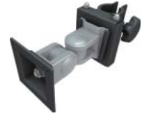
KD-M01P LCDモニタージョイント + POLE VESA 75×75mm or 100×100mm対応 耐荷重8kg 5900034 参考価格 ¥24,300