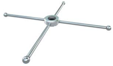
KD-602P ラウンドロッド 4 + POLE 【サイズ】 ロッド直径: 14mm L: 256mm 5900071 参考価格 ¥16,800