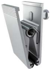
KD-816P/B スクエアクリップ + KCP-700(R) + KD-900 【サイズ】W53×H90mm 5900018 参考価格 ¥5,400