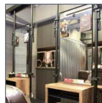
ミラーフレーム + KCP-700(R) + KD-900 5900109 参考価格 ¥60,600

W595×H1100mm(厚さ6mm)の縦型ミラーやアートボードに対応しております。