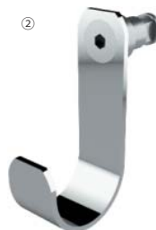
② KD-812P/BUフック + KCP-700(R) + KD-900 5900075 参考価格 ¥2,800