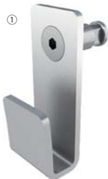
① KD-813P/B コンパクトUフック + KCP-700(R) + KD-900 5900006 参考価格 ¥2,600