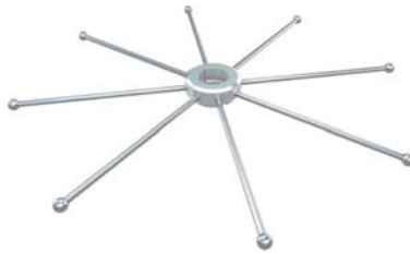
KD-603P ラウンドロッド 8 + POLE 【サイズ】 ロッド直径: 6mm L: 206mm 5900070 参考価格 ¥16,800