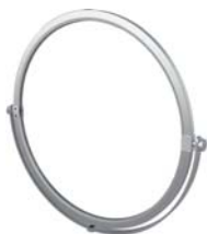
KD-855S ラウンドフレームS + KCP-700(R) + KD-900 【サイズ】φ500mm t6mmまで 5900077 参考価格 ¥20,200