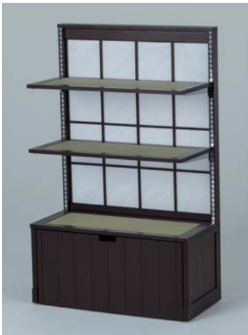
幅広・紙貼りあり&畳棚