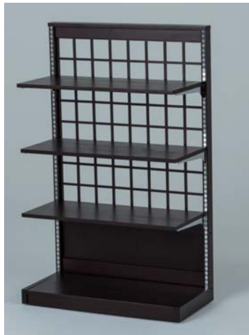
幅狭・格子のみ&木棚