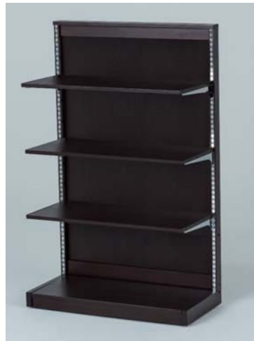
木板(シナベニヤ)&木棚

格子タイプ・紙貼りの有り無し・畳棚板などバリエーションは様々です。ガラス棚や別注色等も可能です。