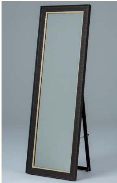
姿見仕様 (外: 46-3037/ 内 A-70000)

お店の雰囲気と売り場の大きさに合わせた姿見を製作可能です。 ※写真は、スタック (二重) フレーム仕様 (別途見積) の製作例です。