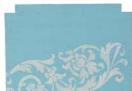
テクスチャー&パターン