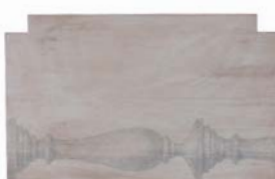
アンティーク&スケッチ