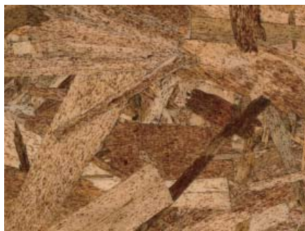
JASスタンプ無OSBボード OSB本来の色と柄がお好みの方はこちら。