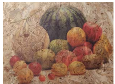
ダイレクトプリントOSBボード 「サンダー処理OSBボード」に印刷したボードです。 ※構造用・JASスタンプ無には印刷できません。