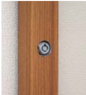
マグネットクロス仕様

【仕様】フレーム:アルミ押出材・(ステン)アルミ仕上げ・(木目)木目シート貼り仕上 面板:2mm透明アクリル/5mmプラダン 付属部品:直付け用ビス