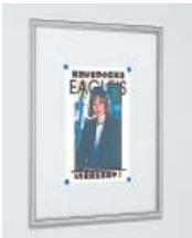
ホワイトボード仕様