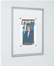
ホワイトボード仕様