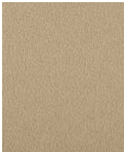
マグネットクロス仕様

【仕様】フレーム:アルミ押出材・(ステン)アルミ仕上げ・(木目)木目シート貼り仕上 面板:2mm透明アクリル/5mmプラダン 付属部品:直付け用ビス