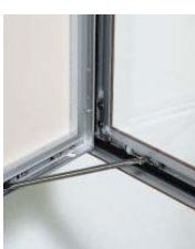
過剰開き止め付き