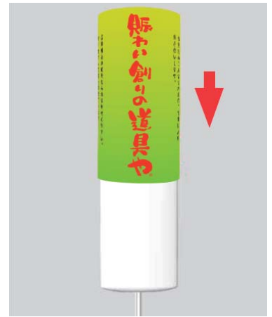
本体と印刷幕に分かれているので、印刷幕を差し替えれば、広告を変えることも可能です。