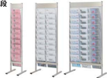
PRC-101 A4判1列 PRC-102 A4判2列 PRC-103 A4判3列

●ラックのかけ方(裏面) 写真のように、ラックをワイヤーに引っ掛けてご使用ください。