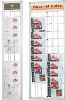
HRW-11M A4判1列 HRW-12M A4判2列