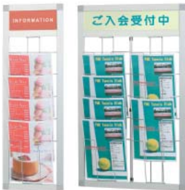
HRW-51M A4判1列 HRW-52M A4判2列