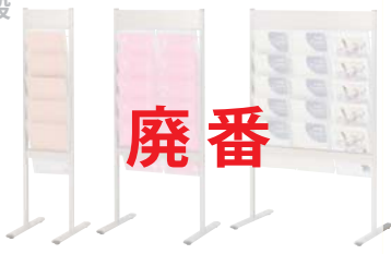
PRC-051 A4判1列 PRC-052 A4判2列 PRC-053 A4判3列