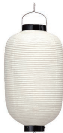
12号長(和紙・針金) 【サイズ】φ320×H700mm 【5133008】 参考価格 ¥8,800