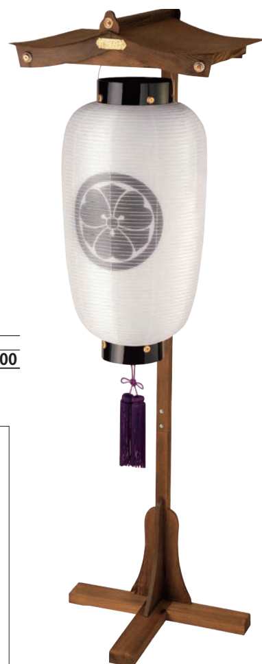
屋形焼杉 【サイズ】W600×H1950mm ※ちょうちんは別売です 【5133010】 参考価格 ¥45,500 ※15号長専用