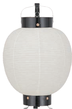
尺子弓張 【サイズ】φ270×H430mm 【5133002】 参考価格 ¥14,200