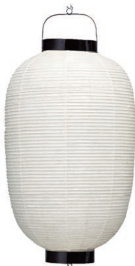
15号長(和紙・竹骨) 【サイズ】φ430×H850mm 【5133006】 参考価格 ¥20,700