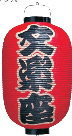
17号長(和紙・竹骨) 【サイズ】φ470×H900mm 【5133011】 参考価格 ¥27,500 ※使用例 色、名入れ代別途

でも、「ちょうちん」を使う場所はいろいろあると思います。たとえば和風雑貨のお店の看板、催事や中元歳暮の装飾に、またズラッと並べて陶器屋さんのファサード等etc…考えれば色々面白く新しいイメージが湧いてくる、古くて新しい商品だと思います。