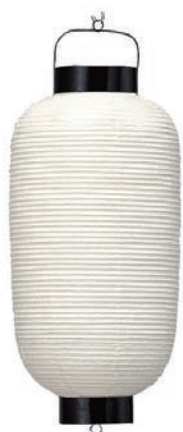
9号長(和紙・針金) 【サイズ】φ240×H600mm 【5133009】 参考価格 7,600