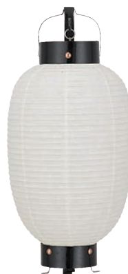
丸丸弓張 【サイズ】φ215×H500mm 【5133004】 参考価格 ¥12,200