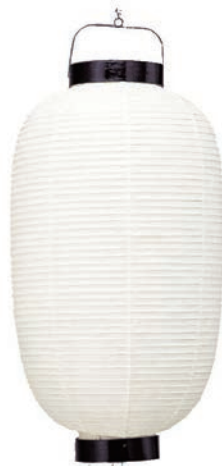
13号長(和紙・竹骨) 【サイズ】φ350×H740mm 【5133007】 参考価格 ¥18,900