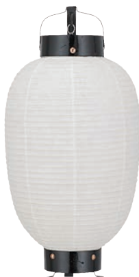
丸丸弓張 【サイズ】φ240×H550mm 【5133005】 参考価格 ¥13,200