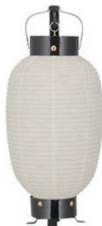
七丸弓張 【サイズ】φ190×H360mm 【5133003】 参考価格 ¥11,900