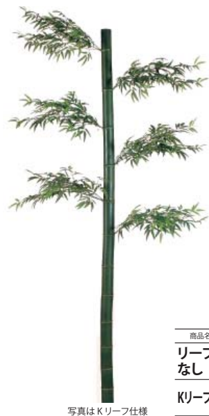
写真は K リーフ仕様