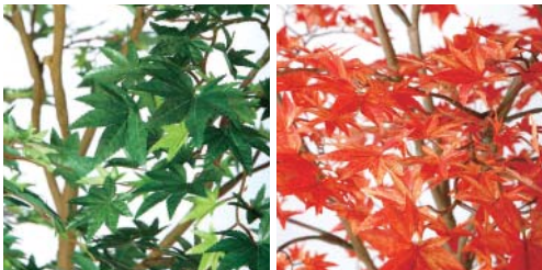
ヤマモミジは細やかな葉のディテールも魅力のひとつです。