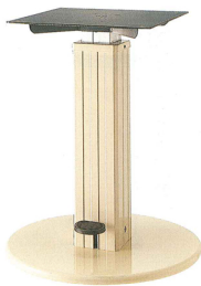
ラウンドN丸ベース H610~800 mm ¥73,700 ベージュ粉体塗装 アジャスター付