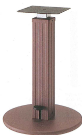
ラウンドN丸ベース H580~770 mm ¥52,400 ラウンドN丸ベース H480~650 mm ¥48,900 ブラウン粉体塗装 アジャスター付