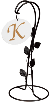
※プレート別売・文字入別料金