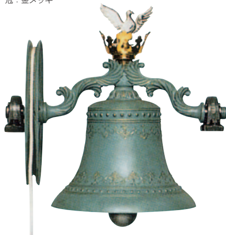
●カリヨン（回転式教会鐘） 寸法図 〈φ 350 39kg〉の例

ベ ル：青銅色着色仕上 アーム：青銅色着色仕上 ハ ト：クロムメッキ 王 冠：金メッキ