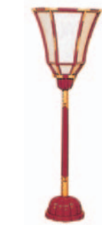
朱塗飾金具付(一対)