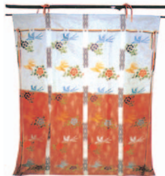
几帳 黒塗台付 模様織込 (一対)