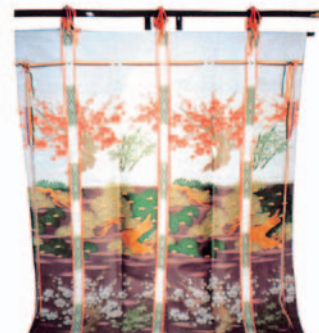
几帳 黒塗台付 模様織込 (一対)