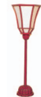
朱塗飾金具ナシ(一対)