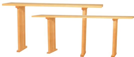
祓串・玉串・鈔子案