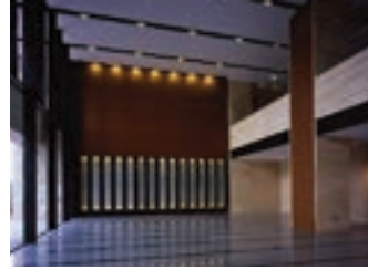
みなとみらいマンションエントランス