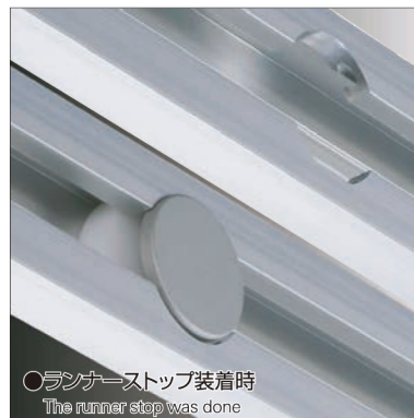
○ランナーストップ装着時 The runner stop was done