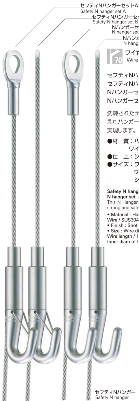
セフティNハンガーセットA Safety N hanger set A