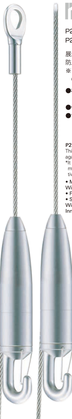
P2ハンガーセットA P2 hanger set A