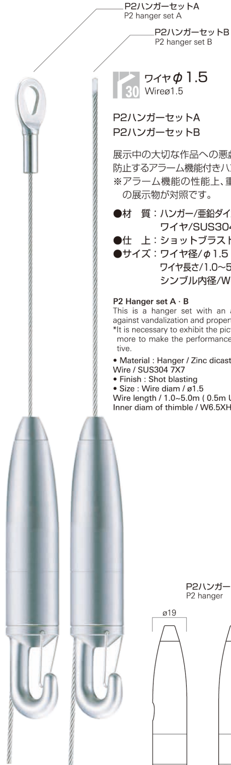
P2ハンガーセットA P2 hanger set A P2ハンガーセットB P2 hanger set B