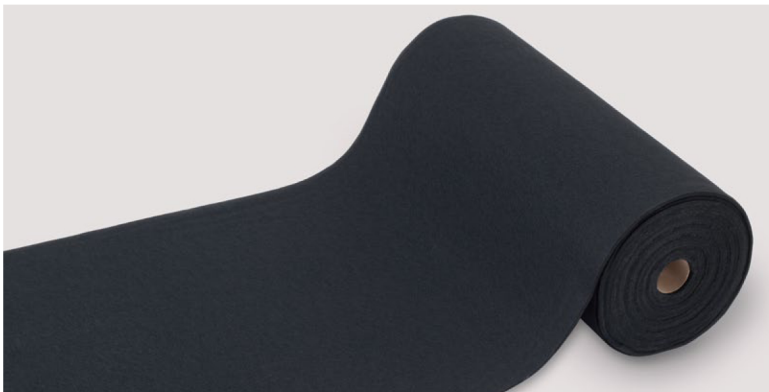
広範囲に敷き詰められるランナータイプ。