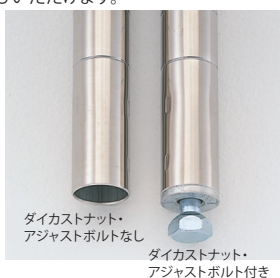
ダイカストナット・アジャストボルトなし

背の低い棚に適した短いサイズから、最長約2500mmまで、各種のポールがお客様の選べいただけます。