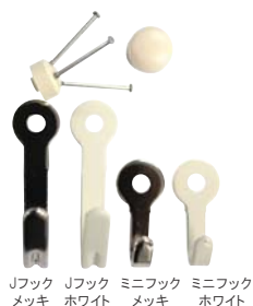
Jフック メッキ Jフック ホワイト ミニフック メッキ ミニフック ホワイト