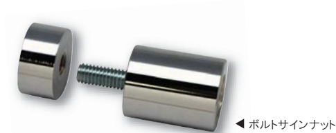
ボルトサインナット

ボルトサインナットは、壁面に取り付けた本体のねじにアクリル板等のパネルをひっかけることで、安全で簡単にサインの取替えが行えるサインナットです。 ご使用になるパネル厚にあわせて選ぶことのできる付属ねじが2種類セットになっており、3～10mmという幅広い適応板厚を実現することができました。 手の届きにくい場所や、頻繁にサインの取替えを行う場合のサイン取り付けに最適なサインナットです。