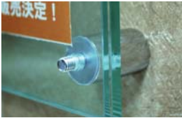
キャップを取り外すだけで、簡単にサインの取替えが行えます。