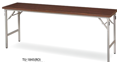
TU-1845(RO) ローズ JAN 093634

バラエティーに富んだ会議テーブルをご用意しました。 使用場所に合わせ、細かい設定を施した商品ラインナップの数々を吟味して、 最適なモデルをお選びください。