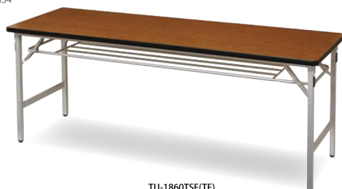
TU-1860TSE(TE) チーク JAN 093856