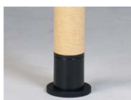
つけかえや微調整が可能です。