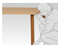
脚をひっぱるだけでお好みの高さに変更が可能です。