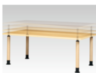
高さの変更が可能。