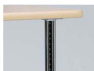
10段階の目もりがあり調整が簡単です。