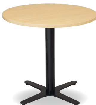
天板：TFY-600 (NA) 脚：ERI-S255 (BK)