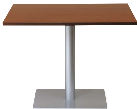
天板：TFJ-960 (HBR) 脚：BON-S755 (SV)