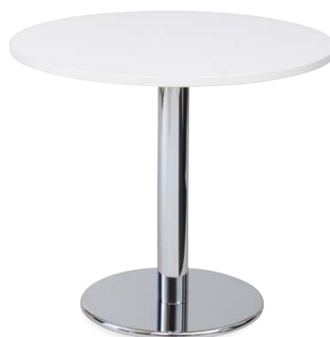
天板：TFJ-750 (IV) 脚：RAU-S745 (CM)