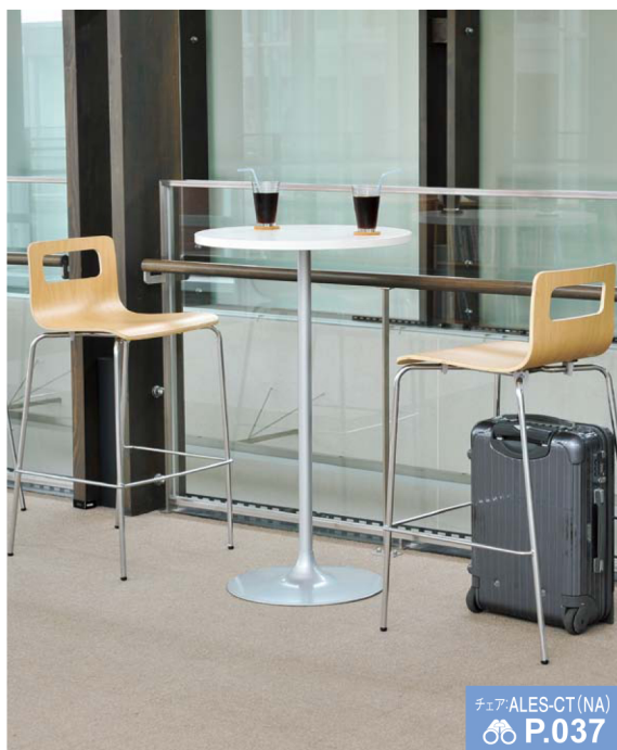
チェア ALES-CT(NA) P.037