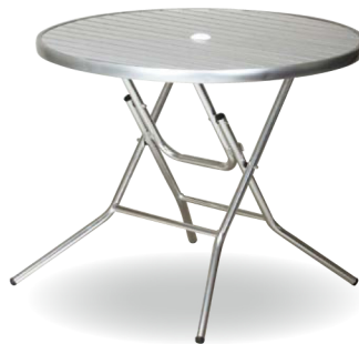
AL-F90RT(AL) アルミ JAN 071144