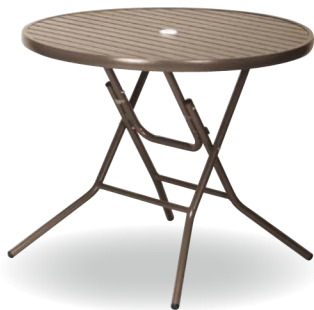
AL-F90RT(BR) ブラウン JAN 071137