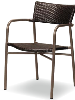
AL-W53AC(BR) ブラウン JAN 071120