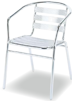
AL-53AC JAN 013632