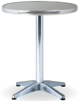
AL-A60RT JAN 063842