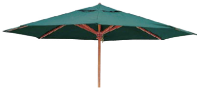
GP-300(GN) グリーン JAN 062586