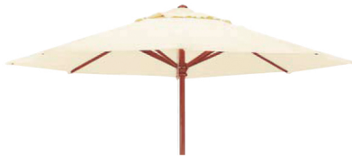
GP-300(IV) アイボリー JAN 062562