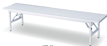
AFB-1S JAN 078839