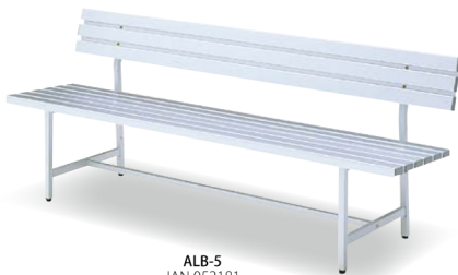
ALB-5 JAN 052181