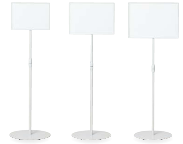
SSW-A4 ホワイト JAN 095515 SSW-B4 ホワイト JAN 095522 SSW-A3 ホワイト JAN 095539

仕様/ボード: ボール紙(ホワイトグレー) 支柱: スチール(19.1mm) 塗装(ホワイトグレー) ベース: スチール 塗装(ホワイトグレー) ●A3(ヨコ)サイズに対応 ●両面タイプ