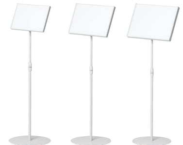
KSW-A4 ホワイト JAN 095546 KSW-B4 ホワイト JAN 095553 KSW-A3 ホワイト JAN 095560

仕様/ボード: ボール紙(ホワイトグレー) 支柱: スチール(19.1mm) 塗装(ホワイトグレー) ベース: スチール 塗装(ホワイトグレー) ●A3(ヨコ)サイズに対応 ●片面タイプ ●サインボード部角度調節可能