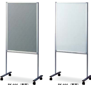
BK-666 (表面) 掲示ボード