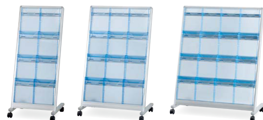
AS-PF8N カセット：クリアブルー