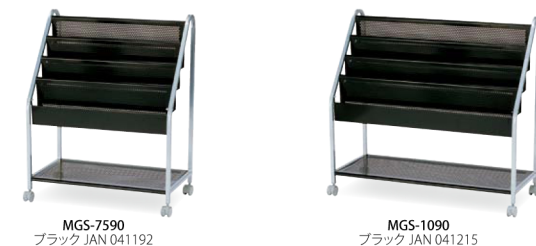
MGS-7590 ブラック JAN 041192

仕様／フレーム：スチール(□20mm) 粉体塗装(シルバー) ラック：パンチングメタル粉体塗装(ブラック)