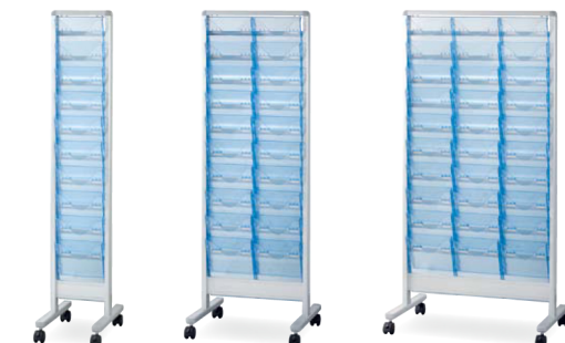
AS-PF10 カセット：クリアブルー