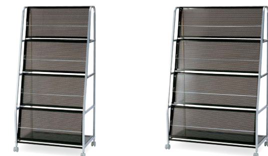
MGS-7515 ブラック JAN 041185