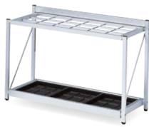
K-F81A JAN 048368