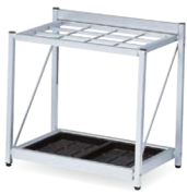
K-F57A JAN 048351

仕様/本体: スチール(25×12mm角パイプ) 粉体塗装(ブラック) 傘枠: スチール 粉体塗装(ブラック) 差込口: W80×D90mm×9個 受皿: 樹脂成型品(ブラック)