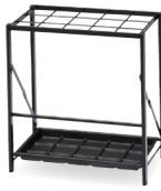
K-F48T ブラック JAN 003046