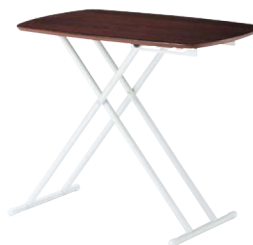
LFT-75W(BR) ブラウン JAN 072509