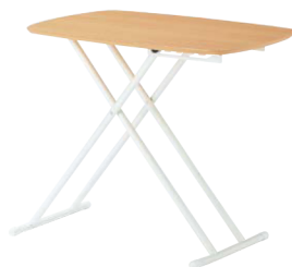
LFT-75W(NA) ナチュラル JAN 072516

梱包寸数：2.1才 梱包重量：8kg ●天板の高さは5段階で調節可能です (H380、H480、H550、H610、H660mm)