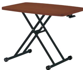
ブラウン JAN 072356