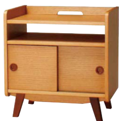
MONIKA-CAN JAN 079386