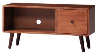
KOKOA-LB JAN 093399