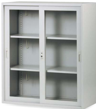
TJ-H90G JAN 062791