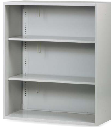
TJ-H90N JAN 062814