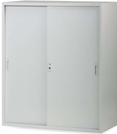
TJ-H90S JAN 062807