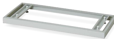
TJ-B90 JAN 062821