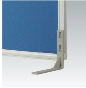
安定脚(片脚タイプ) (PSA-Fx1)