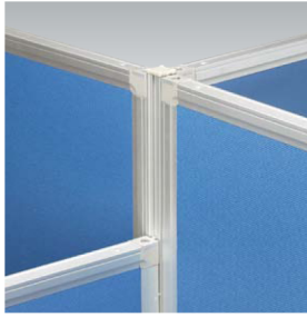
高さ違い連結 (PSA-JK18x1 PSA-MJx4)