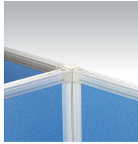
3方向連結 (PSA-JK18 PSA-MJx3)