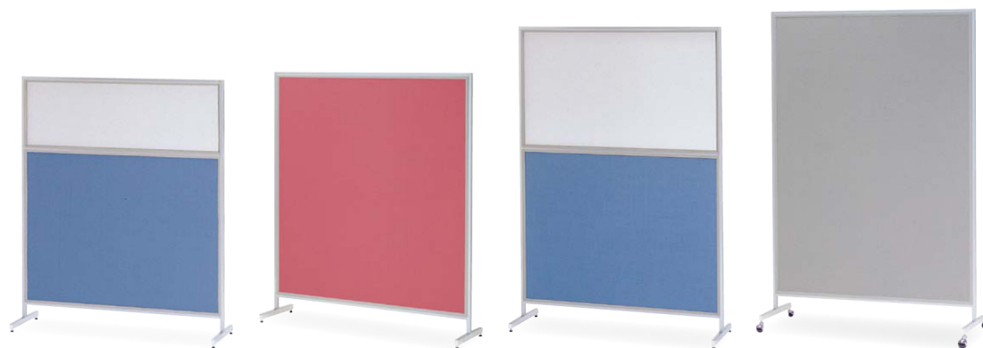
桜-54C (ブルー) JAN 049969