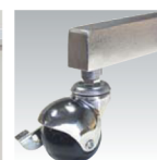
キャスター付 別注対応承ります。