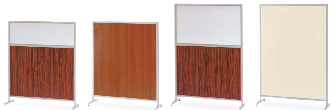
桜-54 (ローズ) JAN 050064