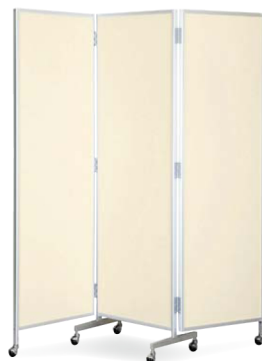
櫛-88 (アイボリー) JAN 068588