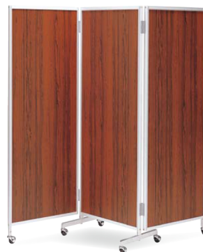
櫛-66 (ローズ) JAN 049952