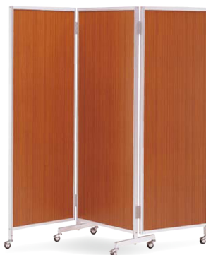
櫛-66 (チェーク) JAN 049945