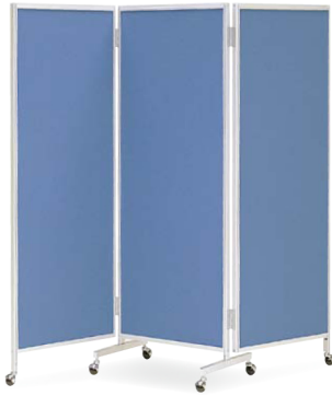
櫛-66C (ブルー) JAN 068533