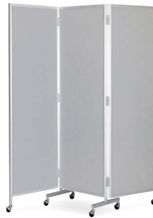
櫛-88C (グレー) JAN 068564