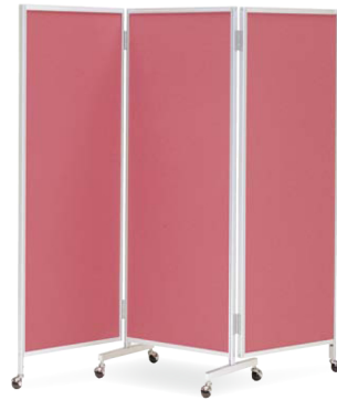
櫛-66C (ワイン) JAN 049914